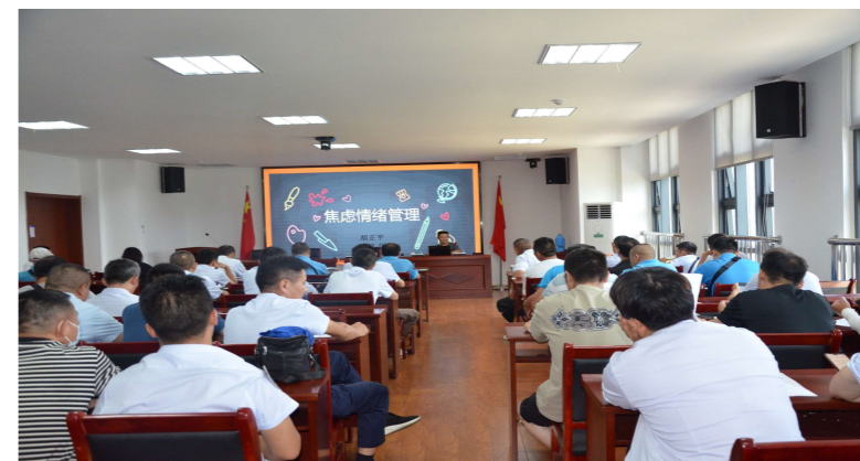
更加和谐融洽的工作环境。此次心理健康培

下一步,高新公交将持续开展职工心理健康培训,全面掌握职工心理健康状况,加强对职工的心理疏导,帮助职工调适心态、自我解压,保障公交安全出行,持续为广大市民提供安全、优质的公交服务。