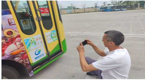
辆上主动让座标识、代币两元标识、禁止携带易燃易爆品等标识有

此次定期检查主要针对车身、车门、车内所有的服务标识、警示标识进行检查,为提高检查效率,高新公交安排专人提前考虑不同车型标识区别,就车