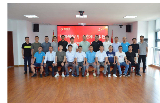
干和专业人才。三是清正廉洁,严守纪律,做守清廉的典范,加强自身道德修养,筑牢思想防线。此次八一座谈会