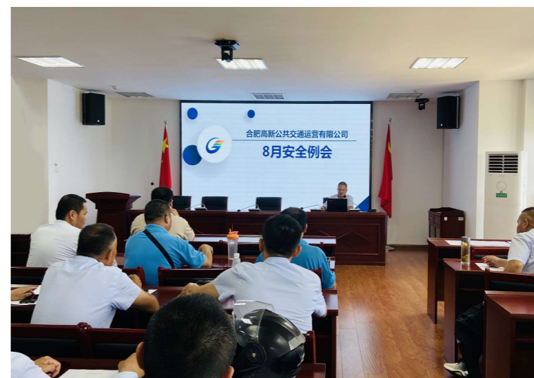
辆。随后,根据近期暴雨天气,提醒驾驶员雨天行车应控制车速,规

会上,首先结合实际案例,强调进出站安全隐患,要求全体驾驶员严格遵守《道路交通安全法》,在车道减少的路段、路口,遇到停车排队等候或者缓慢行驶时,依次交替通行,主动礼让主干道内车