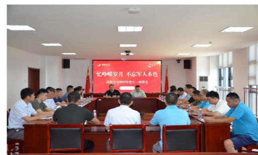
会上,22名退役军人职工重温了各自过往,保持军人本色,为高新公交的发展、安

进一步弘扬了拥军优属的优良传统,营造了爱国拥军的良好氛围。下一步,高新公交将继续